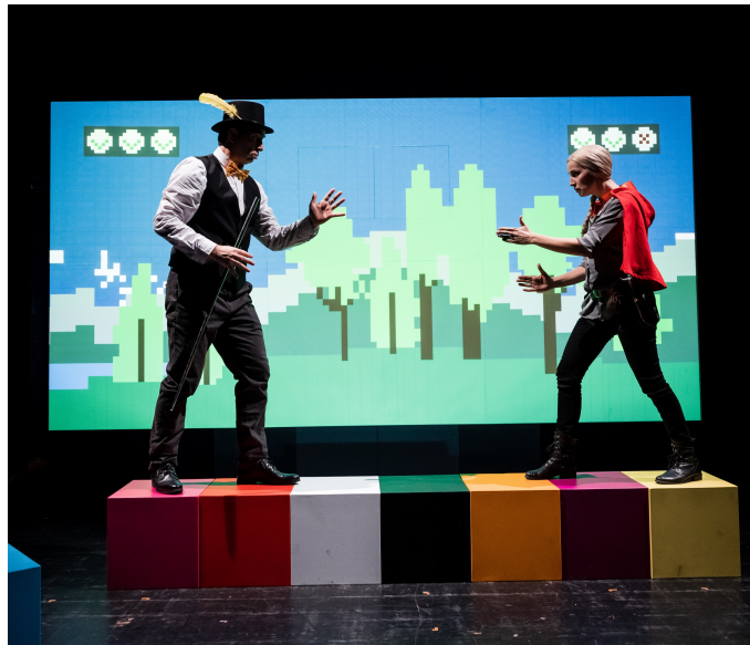
Théâtre du Passage © Guillaume Perret - Lundi 13

Entre innovation et tradition, le public est immergé dans un jeu vidéo se déroulant dans une Suisse ancestrale, la Suisse des Contes et Légendes qui ont façonné notre Histoire. S'aventurant de canton en canton, notre vaillante héroïne Catherine de Watteville, véritable personnage historique qui fut notamment la toute première espionne suisse, découvre au fil de ses dangereuses pérégrinations les mythes et légendes helvétiques. Sur des musiques et chansons originales, ce spectacle humoristique et didactique sera l'occasion pour petits et grands de découvrir ou d'approfondir les trésors cachés et les histoires fondatrices de ce pays confédéré tout en s'interrogeant de façon ludique sur la place des écrans dans notre quotidien.