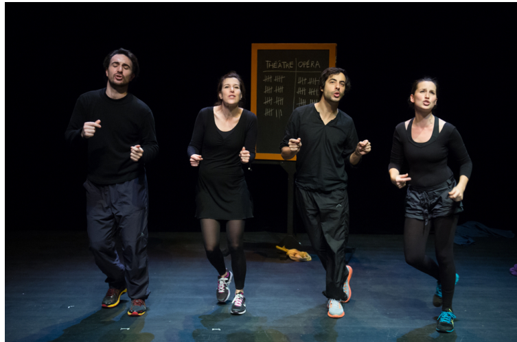
Théâtre du Passage

Endossant les rôles de Suzanne, Figaro, le Comte, la Comtesse, Chérubin et bien d'autres encore, deux chanteurs lyriques, deux comédiens et un pianiste emmènent le public dans un chassé-croisé amoureux, brouillant les pistes, échauffant les cœurs et les zygomatiques. Décapée (1h30 chrono!) et décapante, cette adaptation n'en reste pas moins fidèle à l'esprit des œuvres qui l'ont inspirée et auxquelles elle rend ainsi hommage.