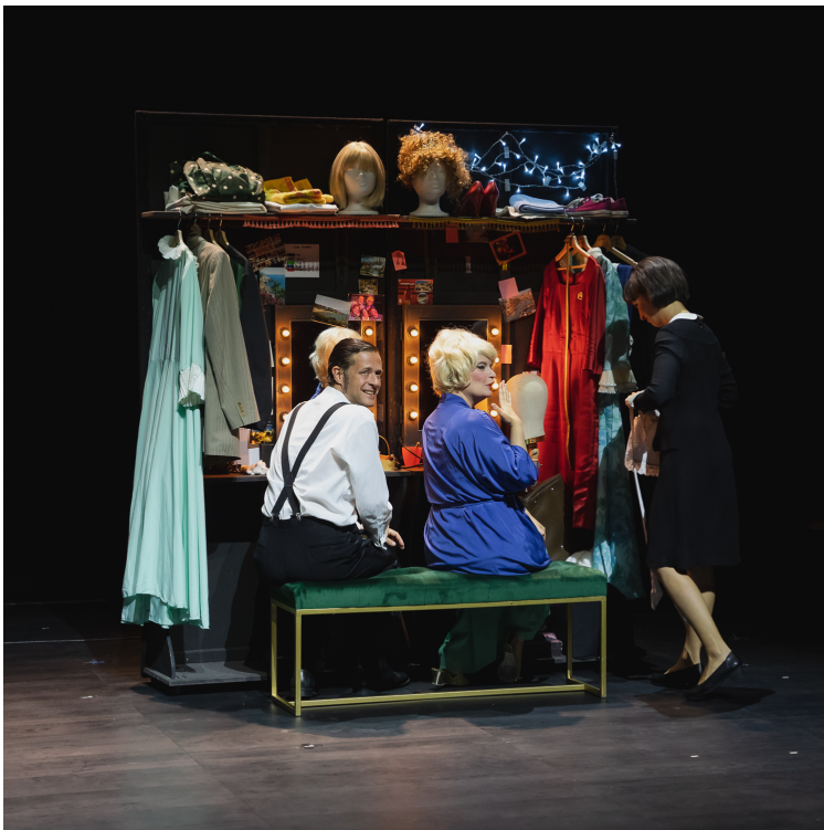
Encore une fois Théâtre du Jura Novembre 2021

Soucieuse de rencontrer un public hétéroclite tant par son goût musical que par son âge, Comiqu'opéra a à cœur de créer des spectacles tout public éveillant la curiosité et la musicalité dès le plus jeune âge. Saluée tant par la critique musicale de renommée mondiale que par la presse locale, la compagnie relève jour après jour le défi de réunir dans une même salle des publics d'horizons diamétralement opposés.